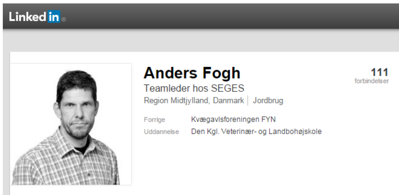
Figur 4: Faglig medarbejder på LinkedIn