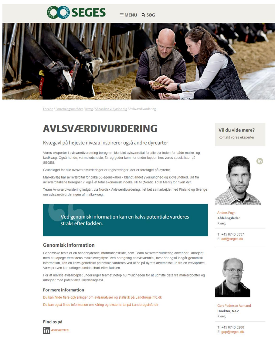
Figur 1: Rådgivningsydelse: Avlsværdiurdering

Herunder ses et eksempel på, hvordan den faglige medarbejder bliver profileret i forbindelse med rådgivningsydelsen "Avlsværdiurdering".