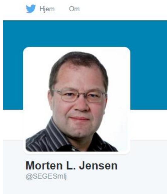
Figur 5: Faglig medarbejder på Twitter